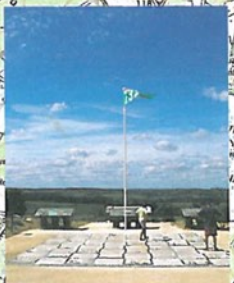
La Bataille de Poitiers (732)