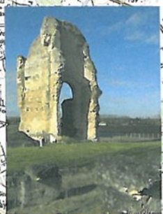
Le site du Vieux Poitiers