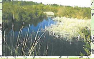
La Réserve naturelle du Pinail