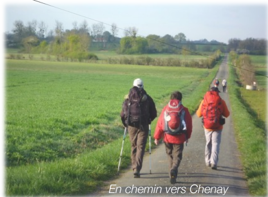
En chemin vers Chenay

Au km 10,5, départ d'un chemin de 1 km pour rejoindre St Sauvant.