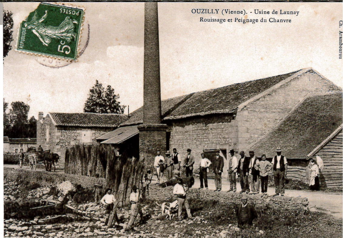
OUZILLY (Vienne). - Usine de Launay Rouissage et Peignage du Chanvre